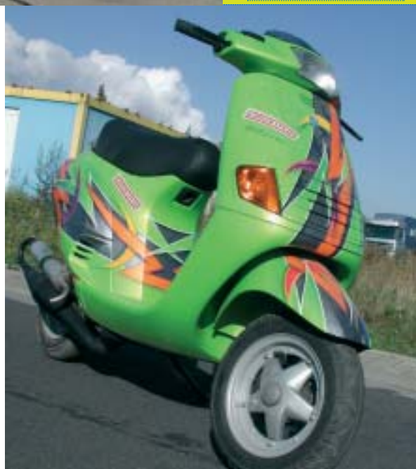
Blickfang: Airbrush-Effektlackierung von Pfeil-Design

Den imposanten Fahrleistungen begegnen die Bergheimer mit einem Bitubo-Fahrwerk, das härter abgestimmt ist und bei den zu erwartenden höheren Geschwindigkeiten verhindert, dass das Race Project gleich bei jeder Gelegenheit schaukelnd durch die Gegend gautscht. Für die dabei notwendige stärkere Bremspower steht im Bedarfsfalle die angebaute Braking Brems-scheibe gerade, die mit Malossi MHR-Belägen eine knackige Verzögerung bietet. Denn es wäre doch wirklich zu schade, wenn das appetitliche Produkt der Landkölner schon an der nächsten Kurve das Zeitliche segnen müsste.